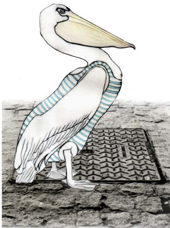
Illustration : Sylvie Lardet

association loi 1901 11, ave du président roosevelt 94120 fontenay-sous-bois tél/fax : +33 1 48 75 12 21 lecoin@lametonymie.com siren : 440 125 540 000 29 code ape : 9001Z